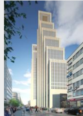
Innovation & Helix