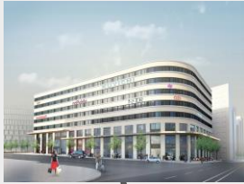
Torsplan 1 (NCC)