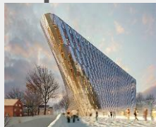
KI auditorium (NCC)