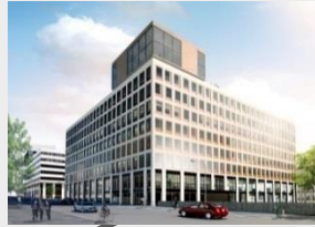
Torsplan 2 (NCC)